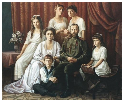
Святые Царственные страстотерпцы – Император Николай II и его семья

в Тобольск. Особой его заботой были вернувшиеся с фронта одурманенные большевицкой пропагандой русские воины, и он создаёт особый солдатский отдел при Иоанно-Димитриевском братстве. Большевики, старавшиеся озлобить солдат, чтобы легче управлять ими, были вне себя, видя проявляемую о бойцах церковную заботу. В это мятежное время Святитель призывал свою паству «не преклонять колена пред идолами революции», борясь против коммунизма, денационализации и искажения русской народной души.